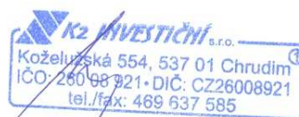
K2 investiční s.r.o.